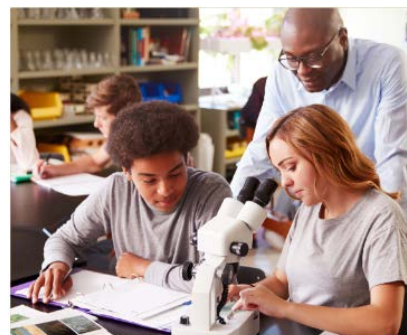
Épreuve pratique d'évaluation des compétences expérimentales en Sciences de la vie et de la Terre (SVT)

→ Vadémécum, typologie des sujets et spécimens