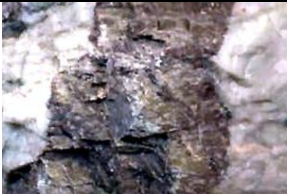
Pyroxène (ex Augite)